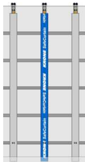
Figura 2: disegno CAD con scritta KRONE Safe Curtain (salvo modifiche)

Ciò significa che per essere conforme alla certificazione XL, non è necessario l'utilizzo delle file perimetrali di perline in aggiunta ai tre piantoni centrali per assicurare il carico lateralmente. Questo è ciò che suggerisce la scritta „KRONE Safe Curtain“, posta su alcune fasce in acciaio (vedi Fig. 2).