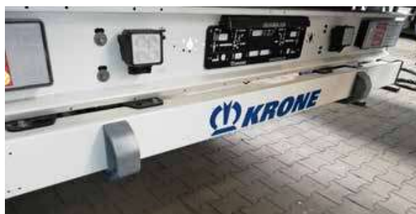
Fig. 3: Nuova versione del pattino montato

Il pattino precedente viene sostituito completamente. Questo significa: